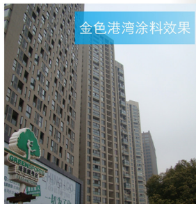
金色港湾涂料效果