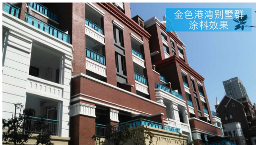
金色港湾别墅群 涂料效果